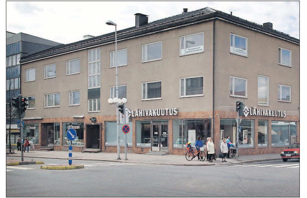
Salora Oy:n uusi hallintorakennus valmistui Turuntie 8:aan vuonna 1956. Väkeä yhtiössä oli jo yli 300.

Salolainen radioverstaas otti 60 vuotta sitten yhtiönimekseen Salora Oy. Samannimisistä radioista oli tehty vuodesta 1937.